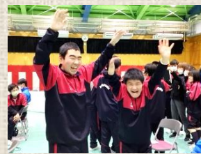
学年の垣根を越えて