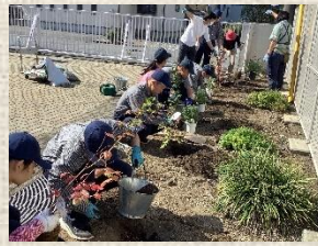
委員会活動で学校貢献