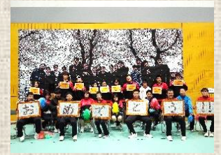
共にやり遂げる貴重な体験