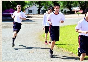
健やかな身体づくり