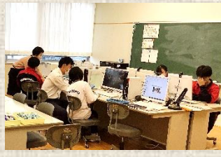
ICTを駆使した情報教育