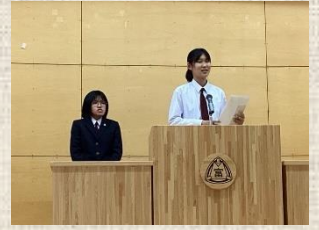
生徒主体の生徒会活動