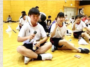
ジェンダーの枠を越えて