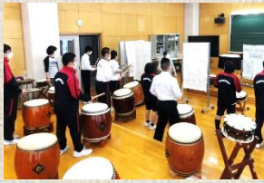
多様な技能・表現力向上