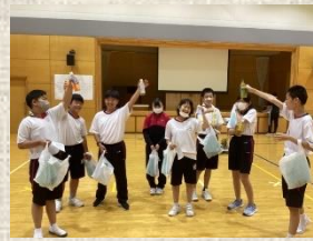
3学年合同レクリエーション